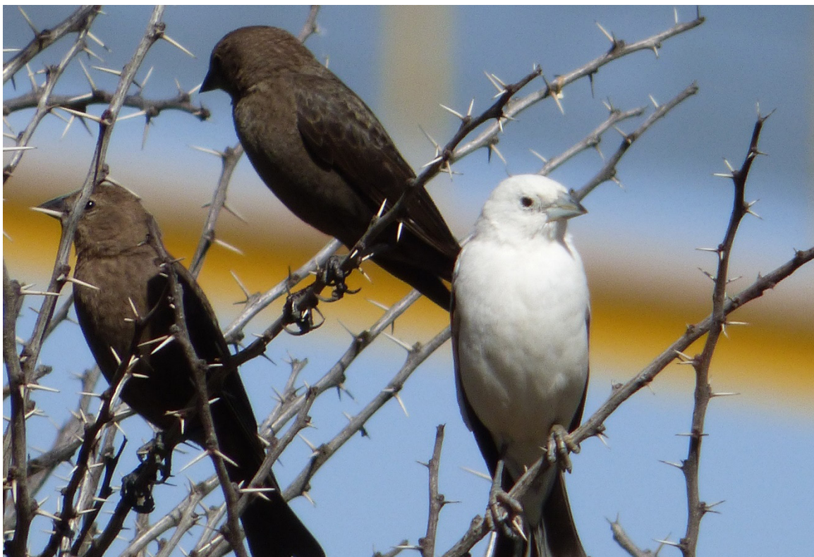
Figura 2. Hembras adultas de Molothrus ater con plumaje normal (izquierda) e individuo con leucismo parcial (derecha) con patas y pico afectados.

Existen estudios que indican que para especies como P. domesticus , la incidencia de leucismo resulta más común en ciudades (1-2%), en contraste con zonas rurales (Il'enko 1960 citado en Moller y Mousseau 2001), con lo que se sugiere que los factores asociados a estas alteraciones son más frecuentes en áreas contaminadas (Moller y Mousseau 2001). M. ater es actualmente una especie común en sitios donde se desarrollan actividades de ganadería y agricultura intensiva (Petit 1996). El rango de distribución histórico de esta especie se encontraba limitado a los grandes pastizales y llanuras de América del Norte; sin embargo, a partir de la fragmentación del eco-