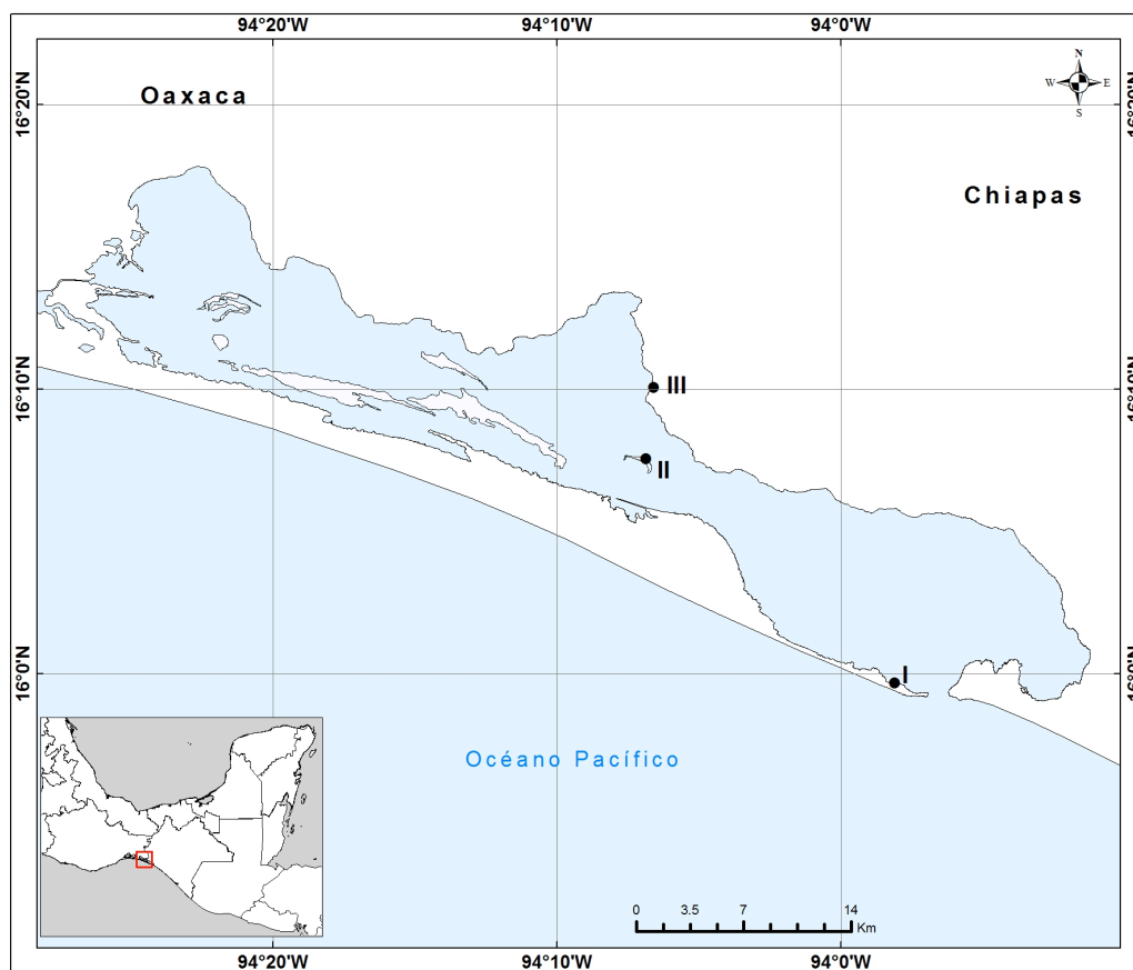
Figura 1. Localización de los sitios de muestreo en la laguna Mar Muerto, Oaxaca-Chiapas: (I) Boca Tonalá, (II) isla Los pájaros y (III) comunidad de Santa Brígida (elaboró: J.L. Liévano Trujillo).

y la abundancia (total de registros de cada especie obtenidos durante todo el estudio). Para determinar el uso del espacio en cada paisaje contabilizamos aquellos individuos observados en actividad dentro de las zonas identificadas, asumiendo que cada ave usó una zona cuando ésta se encontró anidando, alimentándose, en posa o nado (Ortiz-Pulido et al. 1995). Las zonas identificadas en cada paisaje fueron: espejo de agua (EA), planicie lodosa (PL), planicie de conchal (PC), playa arenosa (PA) y manglar (M). Aquellas aves que registramos en vuelo no fueron consideradas para este fin.