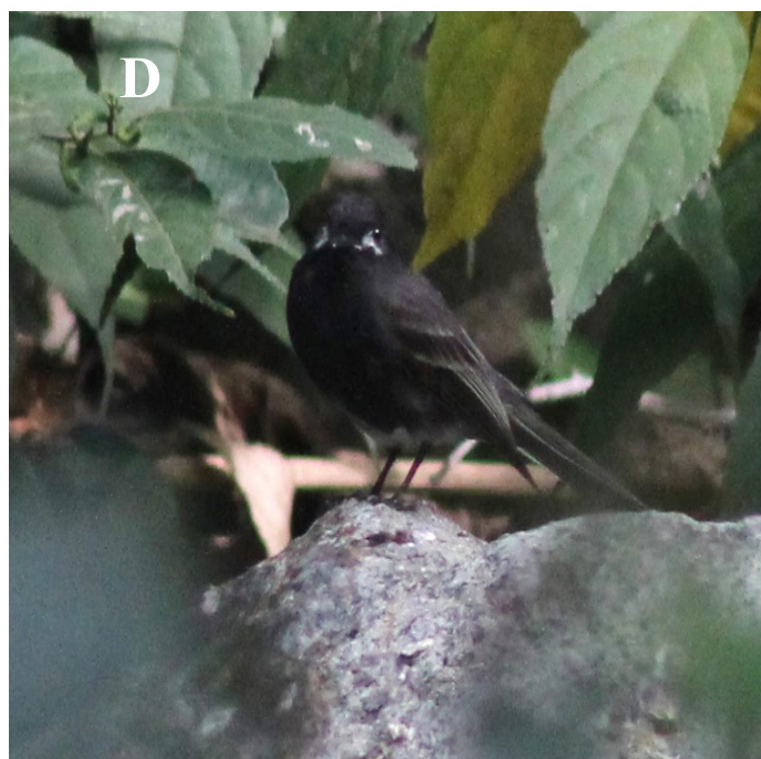
Figura 1. A) Papamoscas negro ( Sayornis nigricans ) con coloración normal (fotografía: Aguilera-Ortega JE). B, C y D) Individuo con leucismo parcial (amelanismo parcial) visto en Tepecoyo, La Libertad, El Salvador (fotografías: Madrid-López WA). Se aprecia los parches blancos en la cabeza, alejados de la columna vertebral (B, C) y con simetría bilateral (D), característico de la aberración cromática descrita.