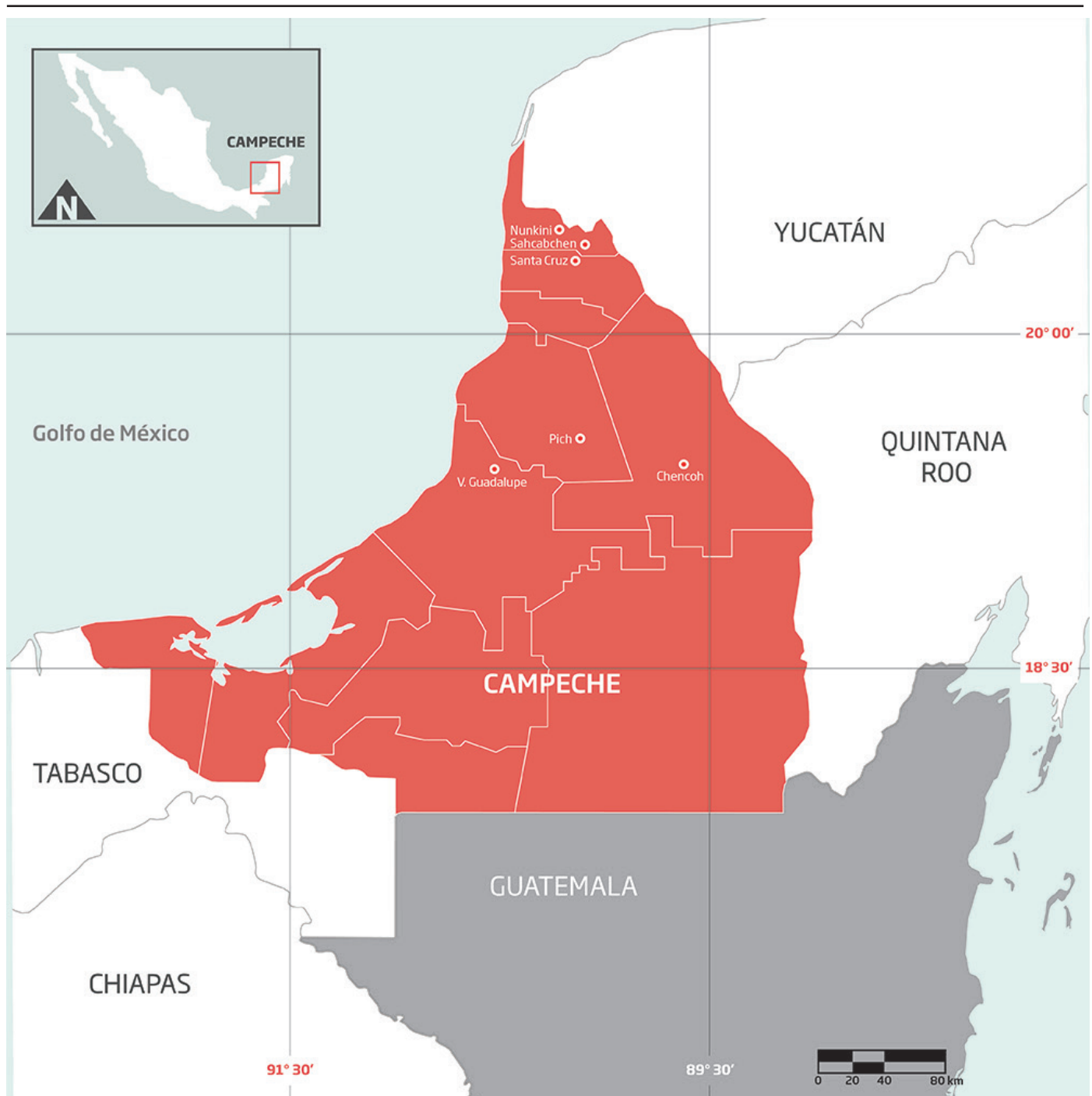
Figura 1. Ubicación de las comunidades mayas con las que se trabajó entre 2010 y 2015 en el estado de Campeche, México.